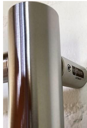
4x massive Wandhalter vom Typ A22

Auch als Elektro- Ausführung erhältlich gegen Aufpreis ab € 159.- inkl. MwSt. betriebsbereit befüllt!