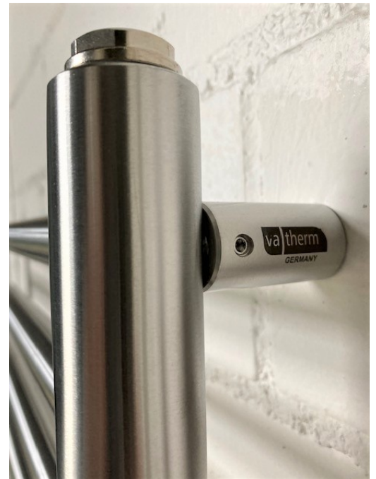
Detailansicht 4x massive Wandhalter vom Typ A

Stückpreis EUR 779.- incl. gesetzl. MwSt. und mit frei Haus- Lieferung innerhalb Deutschland/Festland. Angebot ist nur gültig solange Vorrat reicht.