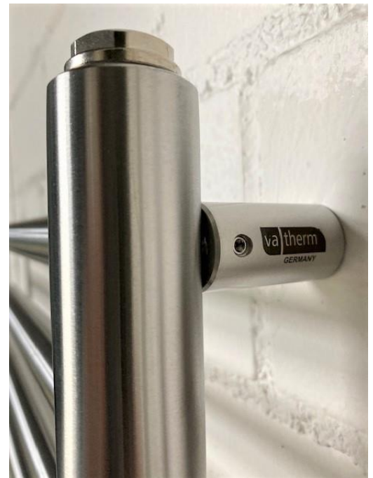
Detailansicht 4x massive Wandhalter vom Typ A

Stückpreis EUR 798.- incl. derzeit 16% MwSt. und mit frei Haus-Lieferung innerh. Deutschland/Festland. Angebot ist nur gültig solange Vorrat reicht.